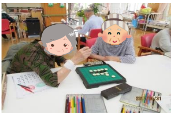
パズルや塗り絵など