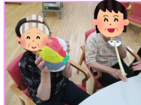
風船を使った機能訓練