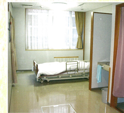
■ 一人部屋 (従来型個室)