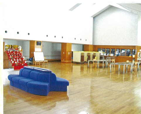
■ 地域交流スペース