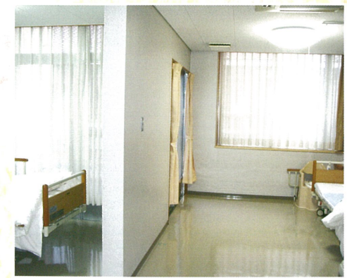
■ 二人部屋 (多床室)