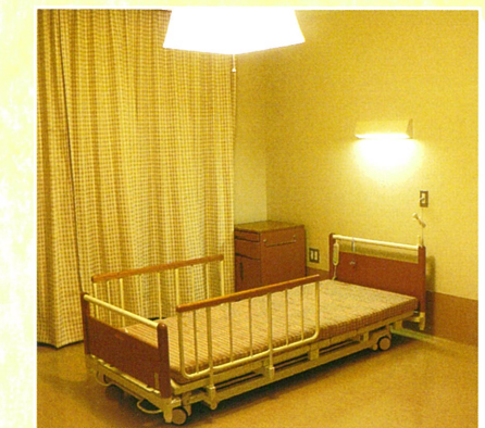
■ ユニット型 個室