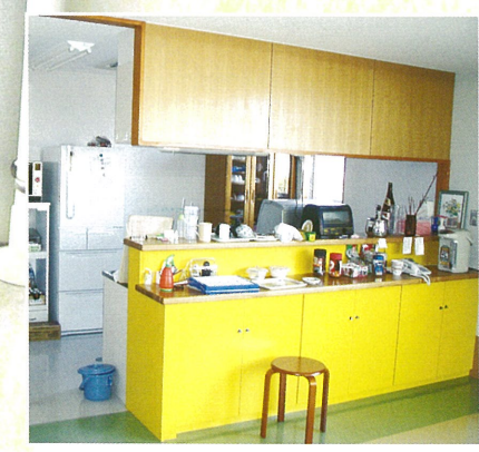
■ ユニットキッチン